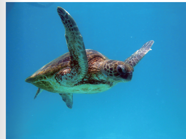
澳大利亚宁加洛礁海洋公园的一只绿海龟。