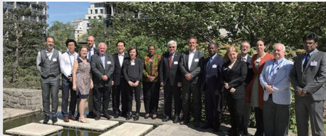
联合国教科文组织在《全球海洋科学报告·第二版》第一次编辑委员会会议期间合影。

专家正式开始撰写《全球海洋科学报告》(GOSR)第二版,预计2020年初出版。《报告》第一版于2017年6月首次发布,确定并量化了国家、地区和全球范围内海洋科学的关键要素,包括劳动力、基础设施和出版物。