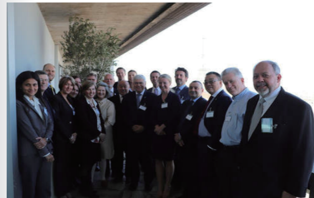
联合国教科文组织/海委会-联合国海洋网络第十七次会议与会代表(2018年3月·巴黎)

作者：朱利安·巴比埃 (Julian Barbière) 发表时间：2018 年 3 月 29 日