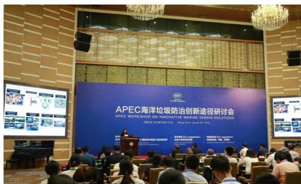
世界银行资深环境专家安贾莉·阿查里雅

本次研讨会着力聚焦海洋垃圾防治的创新解决方案，邀请到 APEC 经济体海洋垃圾管理部门代表、权威研究学者、知名企业代表、相关国际组织到会研讨。研讨会上展示了 APEC 各成员经济体在海洋垃圾防治方面的最新进展和技术，与会代表深入交流探讨了 APEC 区域海洋垃圾管理的经验，为减少海洋垃圾汇集技术和解决方案的创新思路和智慧。